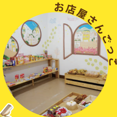
お店屋さんごっこ